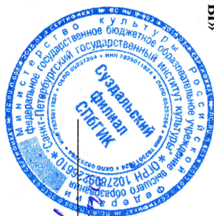
ГРАФИК УЧЕБНЫХ И ПРОИЗВОДСТВЕННЫХ ПРАКТИК НА 2021-2022 УЧЕБНЫЙ ГОД